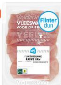
AH Flinterdunne rauwe ham