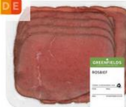
AH Rosbief naturel